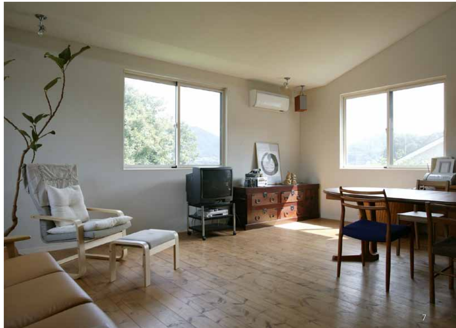
1. 建替え当時の主役。犬のムッシュ。2. 現在の主役は猫に変わった。3. 窓の下の壁は猫の爪跡がたくさん。でも補修しやすい素材にしてあるので安心。4. ロフトは畳敷きで、秘密の部屋の雰囲気。この南面の窓が日射と夏季の通風におおいに役立っている。5. 家の北側にある緑地。下の方に川があるので、夏季には涼しい風を取り込める。6. 玄関にはHさんの作品の他に、別のアーティストの作品も常時展示されている。7. 建替えを機にリビングとダイニング、キッチンも2階に移動し、大きな窓をたくさんつけて冬場の日照不足も解決した。