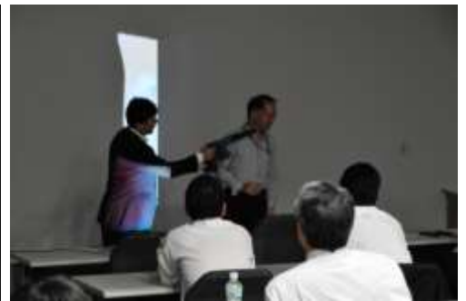
風速 60m/s 体験