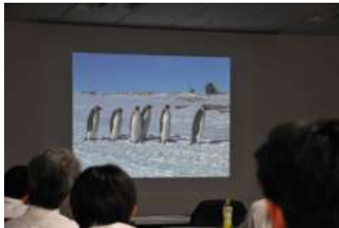
皇帝ペンギンの行進