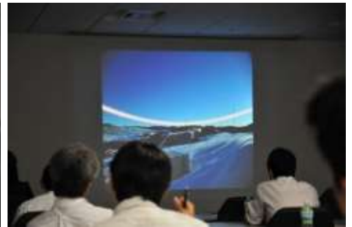
沈まない太陽（白夜）