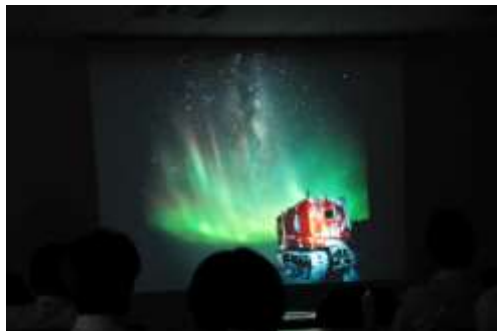
オーロラと雪上車