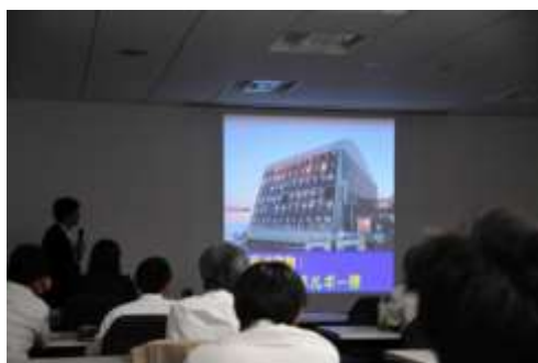
自然エネルギー棟