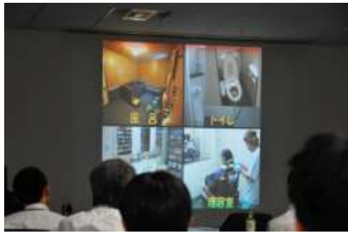
居住棟の内部の様子