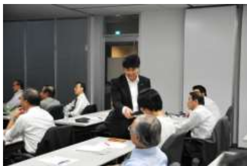
会場とのコンタクトをとりながらの講演